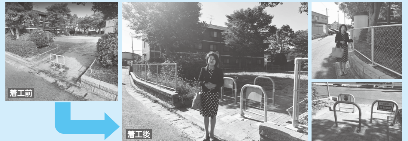
地域の方のご要望を受け子どもの飛び出し防止をするため東二島1丁目1号公園を改善しました。

台風10号は特別警報級とはならなかったものの、大型で非常に強い勢力で九州に接近しました。被害にあわれた皆さまには心よりお見舞い申し上げます。