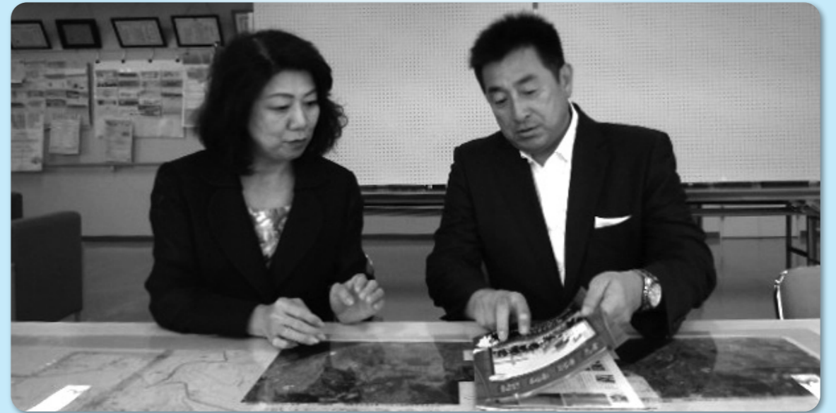
初当選された古賀ゆきひと参議院議員と若松について意見交換