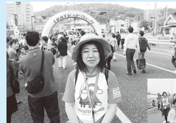
若戸大橋1DAYレッドウォークに参加