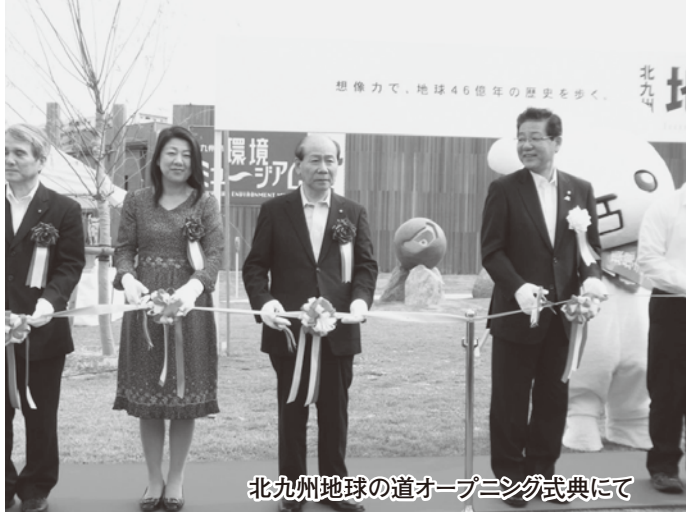
北九州地球の道オープニング式典にて