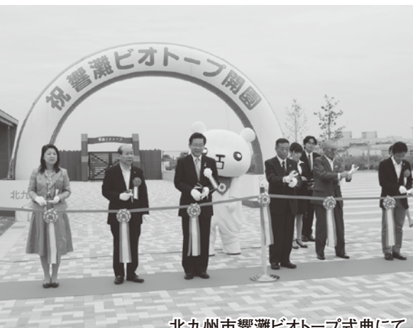
北九州市響灘ビオトープ式典にて

秋も深まってまいりました。今年の夏がとても暑かっただけに、まだ秋というのになんだかとても寒く感じるのは私だけでしょうか? 毎年季節の変わり目は風邪をひきやすいものですが、学校でも結構流行っていてわが子も早々に風邪をひき夜中に高熱を出して急患センターに連れていくなどあたふたしました。みなさまこれから寒くなるだけにくれぐれもお気をつけください。