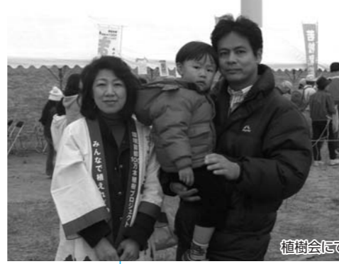
29日 民主党9区講演会