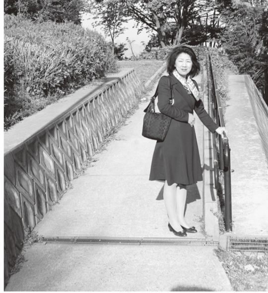
高塔山公園・展望台にて

次々に花だよりの聞かれる季節となりました。あちらこちらとお花見に出かけられる方も多いのではないのでしょうか?きれいな花は心を優しくしてくれたり、癒してくれます。高塔山公園では、展望台への階段がバリアフリー化されスロープが出来ました。又、あじさい祭りに向け頂上部分の整備が急ピッチで進められています。(工事中も展望台の利用はでき、売店も営業しています)北九州市では市の公園などのお花の開花情報をホームページに載せています。ぜひご活用下さればと思います。 ken-ryokusei@city.kitakyushu.lg.jp 電話での問い合わせもできます。(建設局緑政課 093-582-2466)